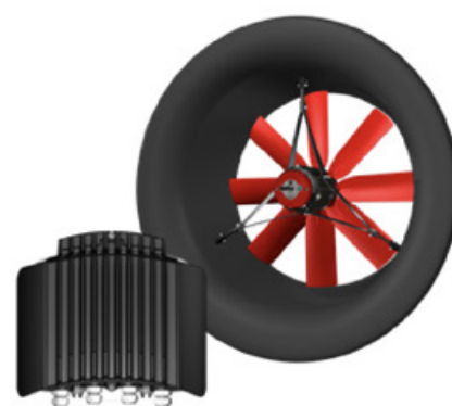
WENTYLATOR WYSOKOCIŚNIENIOWY ECPLUS