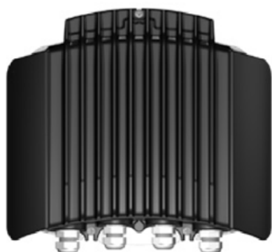
INTELIENTNY NAPĘD WENTYLATORA

Istniejące wentylatory również mogą korzystać z usprawnień energooszczędności wykorzystując Inteligentny Napęd Wentylatora (IFD). IFD zapewnia oszczędność energii do 72%. Będą one działać znacznie wydajniej w porównaniu z wentylatorami ze sterowaniem Triac. Skutkuje to niższą temperaturą napędu, co gwarantuje dłuższą trwałość wentylatora. Automatyczna identyfikacja i kalibracja napędu zapewniają łatwą instalację i użytkowanie. IFD dostarczane jest ze złączem alarmowym i przewodem ekranowanym, i objęty jest 3-letnią gwarancją. Chcesz więcej informacji o naszym projekcie? Skontaktuj się z nami pod adresem e-mail: ventilation@vostermans.com .