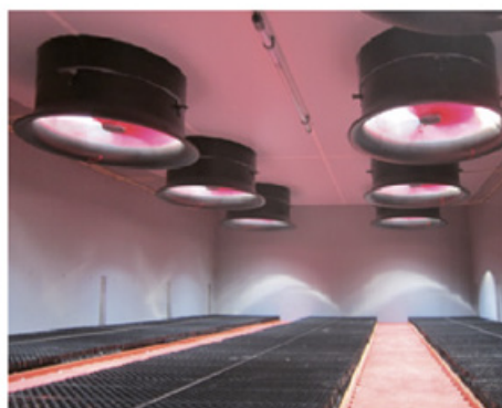
WENTYLATORY Z REGULACJĄ CZĘSTOTLIWOŚCI