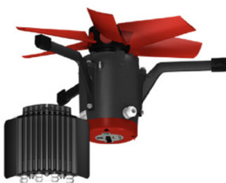
WENTYLATOR KANAŁOWY ECPLUS